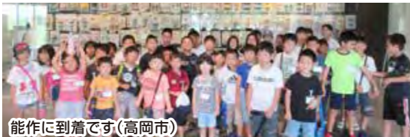
能作に到着です(高岡市)

能作(高岡市)でペーパーウエイト作り体験 ▶▶ 氷見海浜植物園(見学・昼食) ▶▶ 藤子・F・不二雄ふるさとギャラリー見学(氷見市) (44名参加) 8/27 (火)