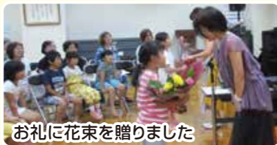
お礼に花束を贈りました

【会場】三和公民館 1階ホール 【出演】音楽ユニット ミルフィーユ (46名参加) 9/14 (土)