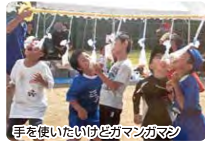
手を使いたいけどガマンガマン