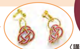
講師 高山 麻紀子氏