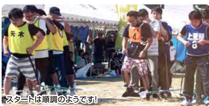
こちらジャンケンで二発逆転るか!