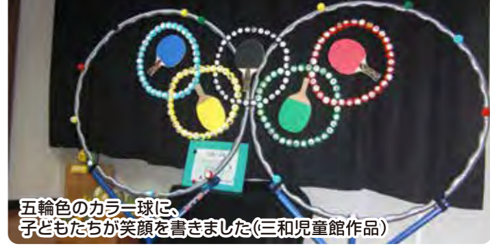
五輪色のカラーボールに、子どもたちが笑顔を書きました(三和児童館作品)