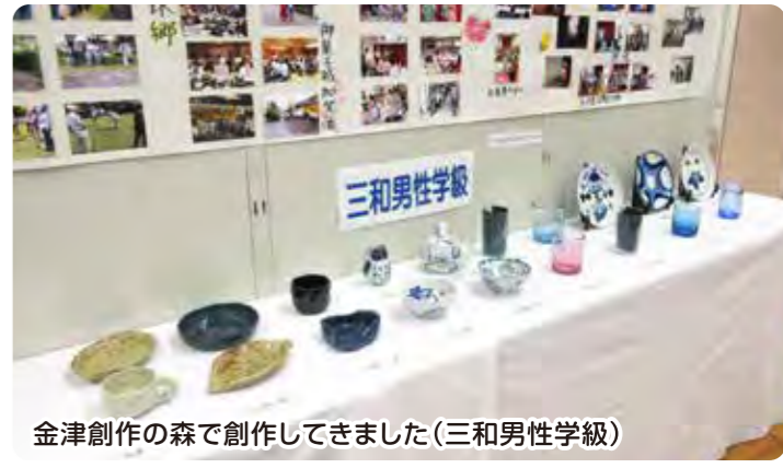
金津創作の森で創作してきました(三和男性学級)

一九七〇年に開催された大阪万博に作られた太陽の塔は、万博が終了した後、長らく一般公開されていませんでしたが、その後耐震補強工事など改修を重ね二〇一八年三月より内部公開が始まりました。内部の展示空間には、鉄鋼製で造られた高さ約四十一階の「生命の樹」があり、樹の幹や枝には大小さまざまな一八三体の生物模型群が取り付けられ、アメーバーなどの原生生物から八虫類、恐竜そして人類に至るまでの生命の進化の過程をあらわしていました。