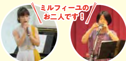
ミルフィーユのお二人です!!