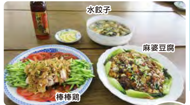
紹興酒に合う中華料理完成です!

景観条例を一九六八年(昭和四三年)全国で初めての「金沢市伝統環境保存条例」を制定した。以後、関連条例は一本制定され、まちづくりの市民の意見が反映され、まちづくりへの参画をうながす契機になればとの行政の思いがあるとのことであった。特に、金沢の魅力について語られたことが印象的であった。このほか、「谷口吉郎吉生記念金沢建築館」は、校下における道路の騒音等や健康面での講話で閉会となった。