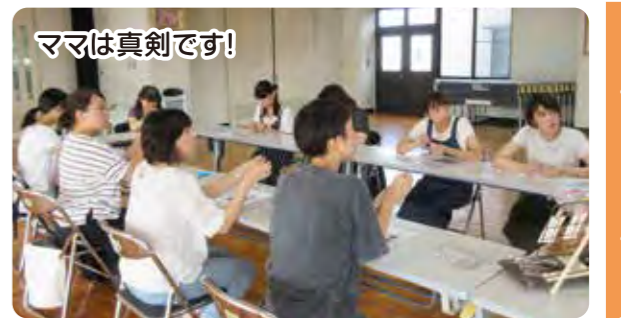
ママは真剣です! 水引でイヤリングやピアスを作りました。