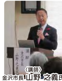
講師 金沢市長 山野 之義氏

山野金沢市長をお招きし、「金沢の魅力「本物」と「広域」と題して金沢に対する熱い思いを語られた。金沢の個性は「歴史と文化」である。加賀藩政は、初代藩主前田利家以来、二八〇年余り、十四代の歴代藩主までいずれも戦いを避け美術工芸と学問に力を注ぐとともに武より、文に重きを置き、徳川幕府より軍備を蓄えるのではこの疑念から目を逸らすための施政をとり、さらには徳川家との姻戚関係を結んだ。非戦災都市として金沢