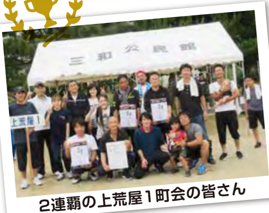
2連覇の上荒屋1町会の皆さん

当日は大会準備中に雨に降られたが、開始後は絶好の運動会日和に恵まれた。第四十回三和校下体育大会が、九月二十九日(日)に三和小グラウンドで開催された。今年、開始直前までの雨の影響で、残念ながら、こまどりこども園、矢木保育所の可愛い園児たちの演技は見る事が出来なかったが、一般競技や町会対抗の各種競技に熱闘が繰り広げられた。昼食タイムには、東京オリンピック・パラリンピックを盛り上げようと「東京五輪音頭2020」で、三和児童館の児童を中心に大人たちも参加して、大きな踊りの輪が広がった。今回、全ての町会が優勝できるような思いで加えられた新種目の「二発逆転玉入れ」では、想定外の高得点がでたこともあり、得点方法等について、課題が残った。