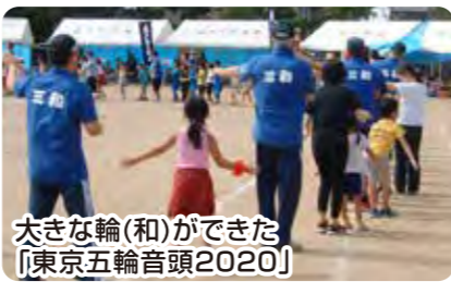
大きな輪(和)ができた [東京五輪音頭2020]