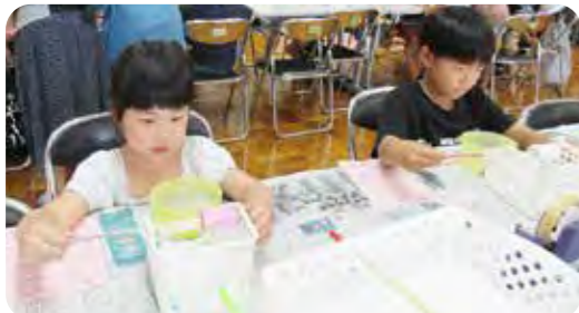
一点を見つめて集中している「まゆ糸とり」