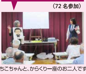
ちこちゃんと、からくり一座のお二人です