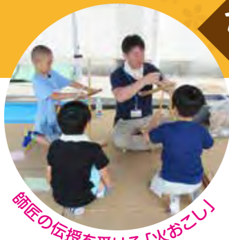
師匠の伝授を受ける「火おこし」