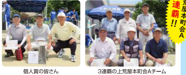
個人賞の皆さん 3連覇の上荒屋本町会Aチーム