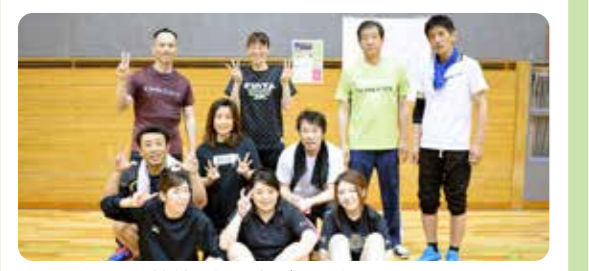
熱戦を繰り広げた三和チーム

七月七日(日)に金沢市総合体育館で開催された、南部地区ソフトバレーボール大会に出場した三和A・Bチームのうち、Aチームは予選リーグ敗退となった。二方決勝トーナメントへ勝ち上がったBチームはベスト四へ進出し、準決勝で西南部公民館に敗れたものの、昨年に引き続き三位入賞を果たした。