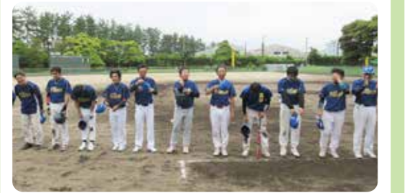
力を出し切り応援席に挨拶をする三和チーム

六月九日(日)に開催された南部地区ソフトボール大会で、初戦の伏見台公民館に最終回追い上げられるも、七対六で接戦をものにした勢いで、第二戦の三馬公民館に十対〇で勝利し、ベスト四に進出した。準決勝戦の米丸公民館には、七対十で惜敗したが、昨年に引き続き三位入賞を果たした。