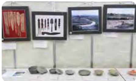
奈良・平安時代の出土品