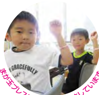
赤が玉ブレスレットに後光?がさしています

第二十三回史跡フェスタみわ「平安まつり」は、昨年に引き続き三和公民館で開催され約百十人が参加した。子どもたちは手を真っ白にしてまが玉をけずったり、平安時代の絵を描いたりしてたくさんさんのコーナーを楽しんでいた。また、今年は七つの体験コーナーの中から四つの体験を終えた先着五十名が「化石発掘」に挑戦した。毎年恒例の手づくりコーナーでは、小さなまが玉とビーズをつなぎ合わせた「まが玉ブレスレット」が大人気で、気をゆるめると瞬間のうちにバラバラに散らばるブレスレットを、慎重に仕上げた。