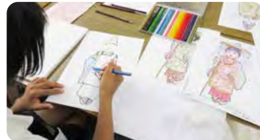
人気を集めた「平安時代の絵」