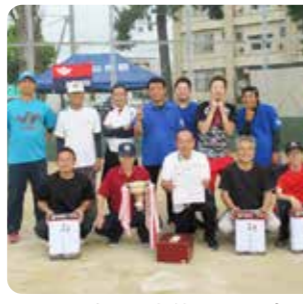
3連覇の上荒屋11町会