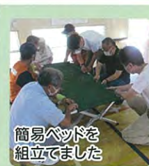
簡易ベッドを組立てました