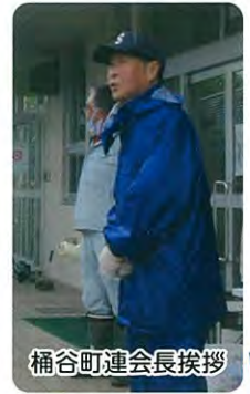
桶谷町連合会長挨拶