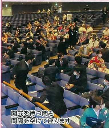
開式を待つ間も 間隔を空けて座ります