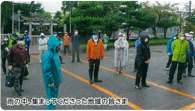
雨の中、集まってくださった地域の皆さま