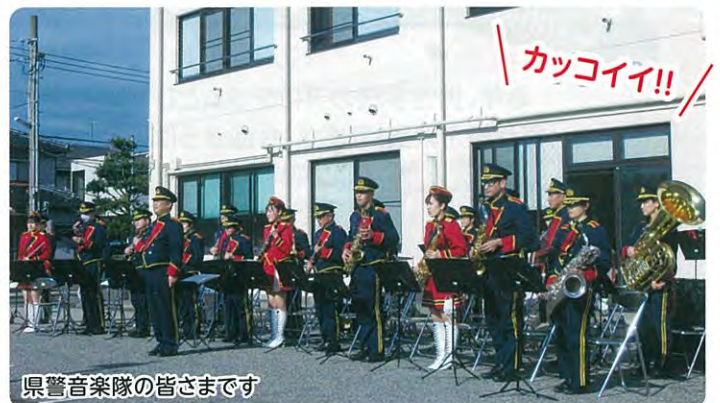
県警察音楽隊の皆さまです