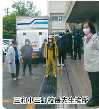
三和小三野校長先生挨拶

まで、十月五日(火)の運動会を安全に実施することができ、ありがとうございます。という感謝のお言葉をいただきました。今後もこの活動を続けていく予定である。