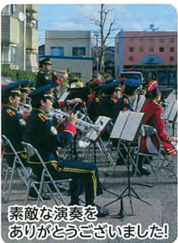
素敵な演奏をありがとうございました!

公民館に到着後は、石川県警察音楽隊による演奏会が開かれ、人気アニメ「鬼滅の刃」の主題歌などが披露され、上荒屋第1児童公園に集まった約200人の住民は年の瀬のひとつ、ミニコンサートを楽しんでいた。