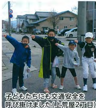
子どもたちにも交通安全を呼び掛けました(上荒屋2丁目)

コロナ禍で、体育行事や文化祭等さまざまな事業が中止となる中、地域住民のつながりを深め、地域の交通安全を願って、十二月五日(日)三和校下町会連合会と三和公民館では校下を練り歩くパレードを行った。