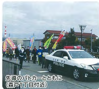
先導のパトカーとともに(森戸1丁目付近)

参加者は先導のパトカーとともに交通安全ののぼりを掲げて校下を回り、道行く人に「事故に気を付けてください」と呼び掛けながら三和公民館に向かった。