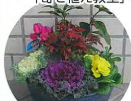
お正月の寄せ植え

毎年、男性学級のプログラムとして開催していた「寄せ植え教室」ですが、今回からは「SDGs学級」として男女を問わず募集しました。講師の松下ガーデンの方から、材料の特徴や植え付け後の管理方法をわかりやすく説明していただき、お正月に向けてきれいな寄せ植えが完成しました。