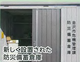
新しく設置された防災備蓄倉庫