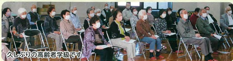
久しぶりの高齢者学級です