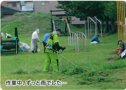
作業中、ずっと雨でした...

まで、十月五日(火)の運動会を安全に実施することができ、ありがとうございます。という感謝のお言葉をいただきました。今後もこの活動を続けていく予定である。