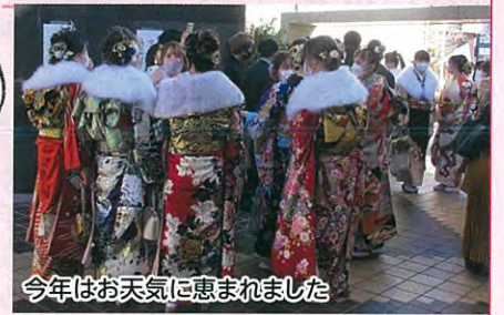
今年はお天気に恵まれました