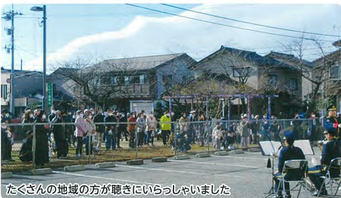
たくさんの地域の方が聴きにいらっしゃいました