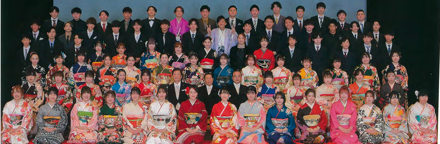
三和校下 新成人のみなさん ~金沢市文化ホール~