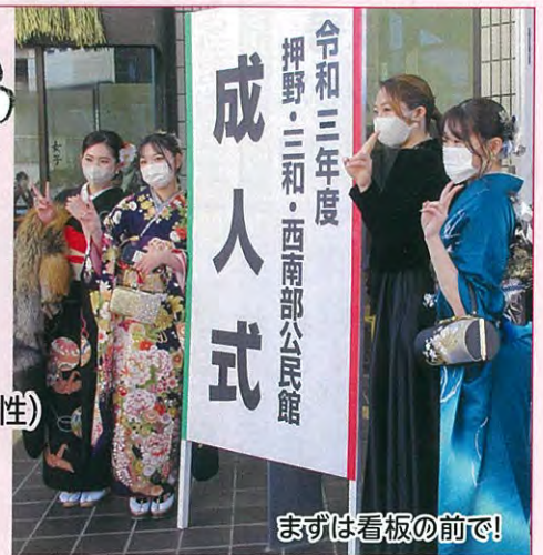
まずは看板の前で!