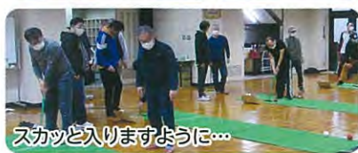
スカット入りますように...

生まれた月日をお互い声を出さずに手指を使って表現し、それで得た情報により月日順に並ぶのだが、並び終えた後、いざ声を出して確認してみると、全然違っていて大笑い。 そのあとスカットボールのセッティング方法を教えてもらい、本番。ゲームが始まるとみなさん張り切りだし、スティックでボールを打ち点数を競い合い、軽快な音を響かせていた。