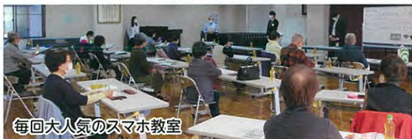
毎回大人気のスマホ教室

総務省デジタル活用支援推進事業の「スマホ教室」が3回開催され、講師の先生のわかりやすい説明にどの回も大好評でした。今後も続けて企画をしていく予定です。