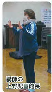
講師の上野児童館長

矢木町会の公民館委員からスタートし三十二年務めさせて頂き、三和公民館役員を三月末日をもって退任させて頂きました。在任中は歴代の館長を筆頭に役員・委