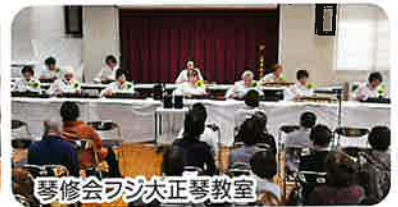
琴修会フジ大正琴教室