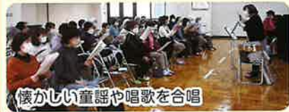
懐かしい童謡や唱歌を合唱