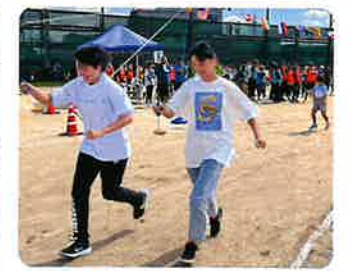
横並びのスプーン競走