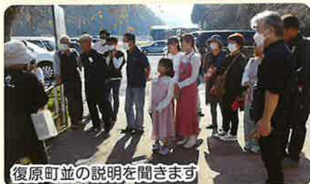
復原町並の説明を聞きます