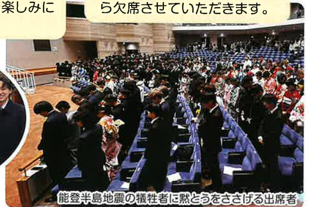
能登半島地震の犠牲者に黙とうをささげる出席者