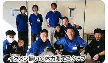
イクメン揃いの体力測定スタッフ