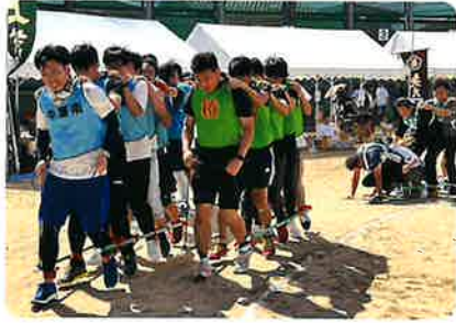
得点表によるとこの結果は?(ムカデ競走)