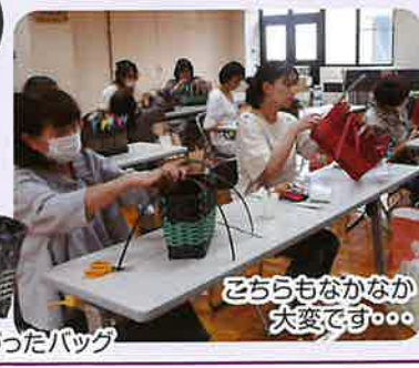
こちらもなかなか大変です。。。