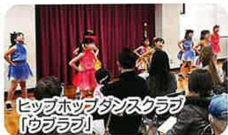
ヒップホップダンスクラブ 「@ブラブ」