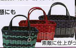
素敵に仕上がったバッグ

何人かで集まって宿題にも取り組みようやく完成!市販品にも負けないような仕上がりに感動していた。