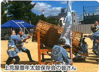
上荒屋豊年太鼓保存会の皆さん