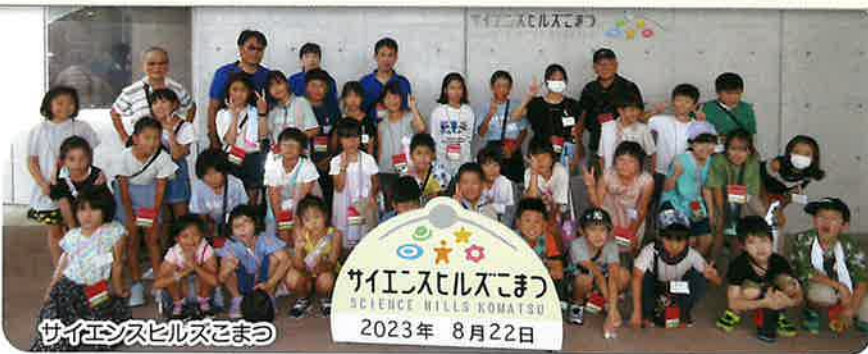
サイエンスヒルズこまつ