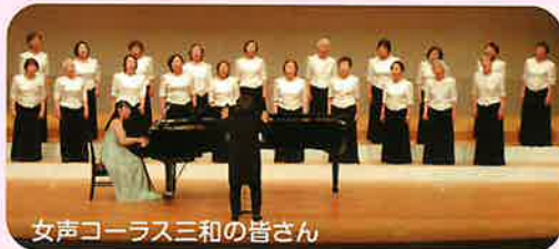
女声コーラス三和の皆さん

5年ぶりにコーラスフェスティバルに出演した女声コーラス三和は「ともだち」「春風の中で」を披露した。