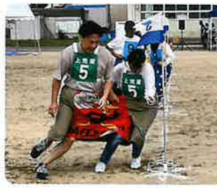
コーナーさばきも軽やかに(デカバン競走)