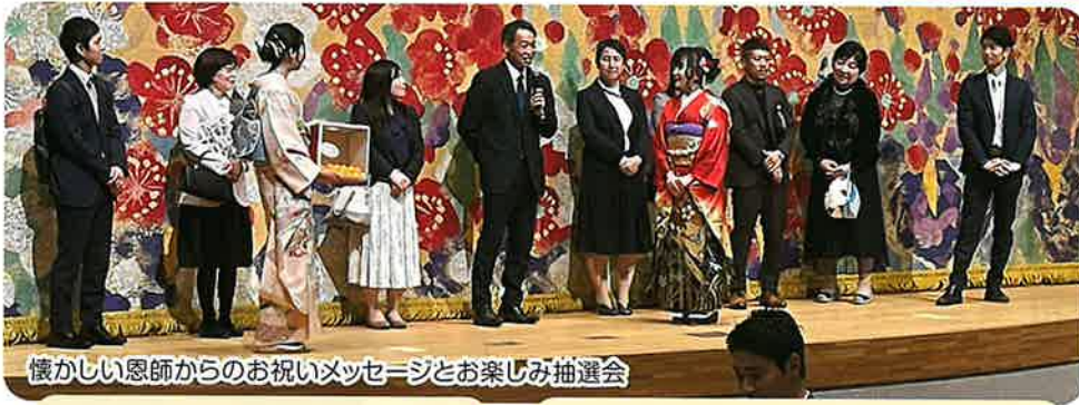
懐かしい恩師からのお祝いメッセージとお楽しみ抽選会