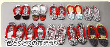
色とりどりの布ぞうり

大人気の「布ぞうり」作りはSDGsの17の目標のうち、12番の「つくる責任つかう責任」だそうだ。布ぞうりは「編む」のではなく「織る」らしく、「織る」とは縦糸に横糸を通すが、縦糸と横糸は別の糸なので、どこか1本切れても全体が解けてしまうということはないそうだ。