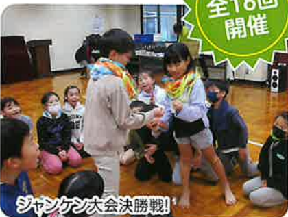
じゃんけん大会決勝戦!