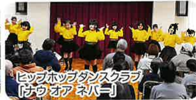
ヒップホップダンスクラブ 「ハウオアネバー」