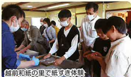
越前和紙の里で紙すき体験