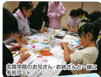
北陸学院のお兄さん・お姉さんと一緒に 手形アート