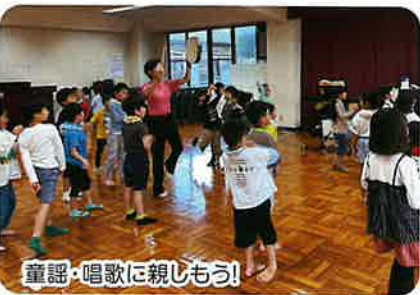
童謡・唱歌に親しもう!