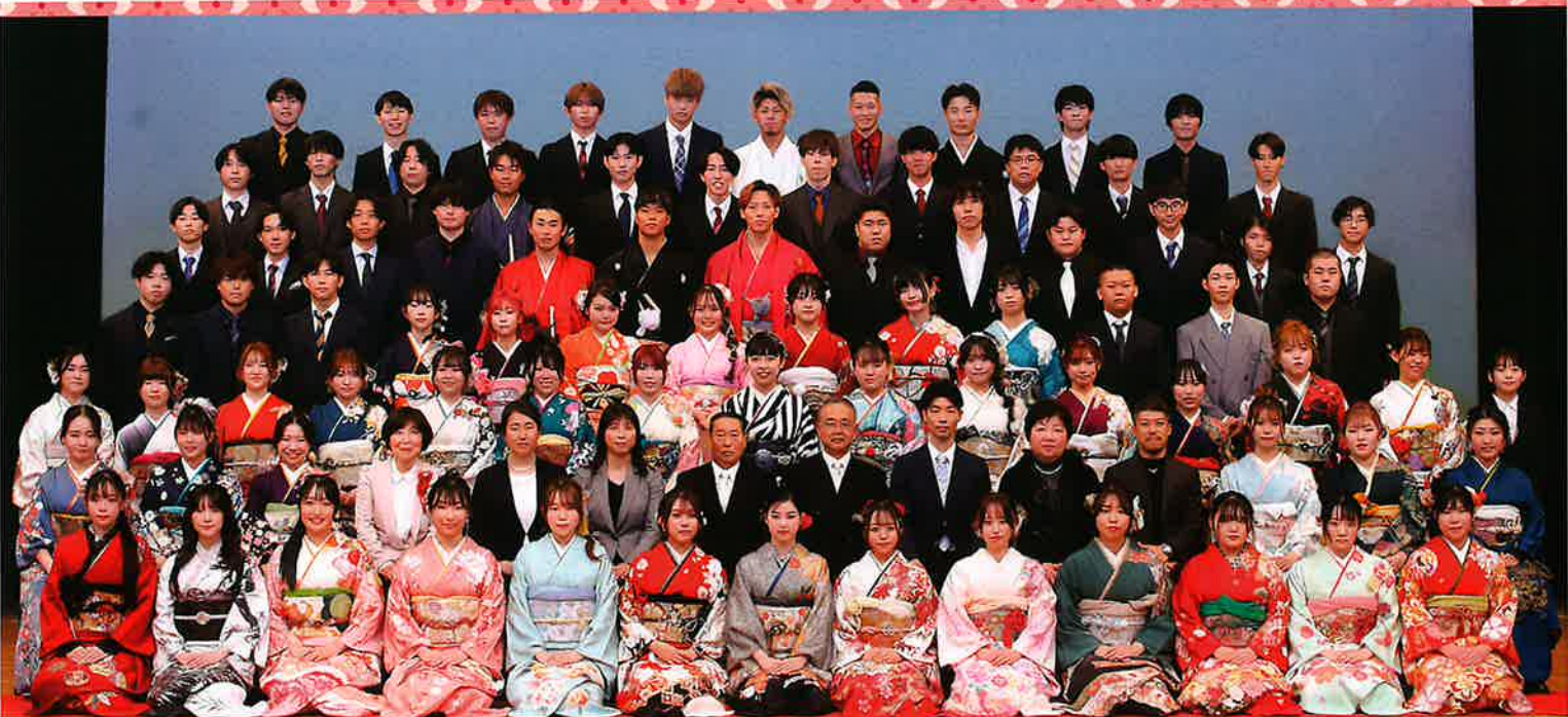
令和5年度「二十歳のつどい」三和校下のみなさん ~金沢市文化ホール~