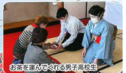
お茶を運んでくれる男子高校生