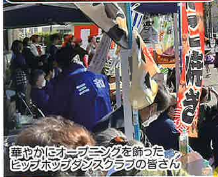
華やかにオープニングを飾った ヒップホップダンスクラブの皆さん