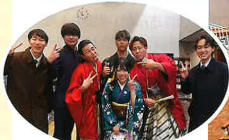
二十歳のつどいを手伝ってくれた三和の皆さん