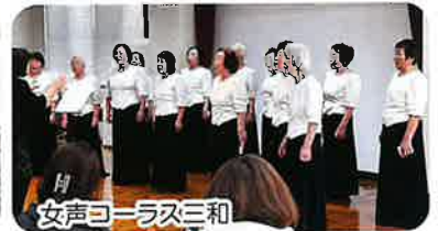
女声ヨークス三和