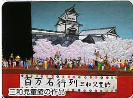
百万石行列 三和児童館 三和児童館の作品