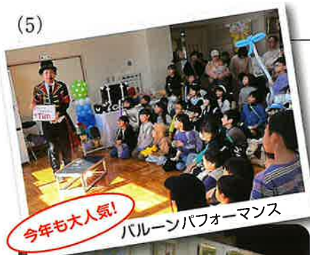
今年も大人気! バルーンパフォーマンス