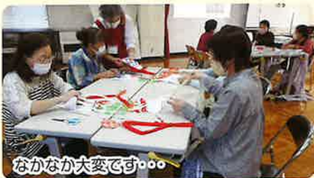
なかなか大変です。。。

100均に売っているフックを利用しながらつま先から織り、約2時間でこんなに素敵な「布ぞうり」が完成した。参加された方は「家でもう一足作ってみよう!」と、ますます意欲を燃やしている様子だった。