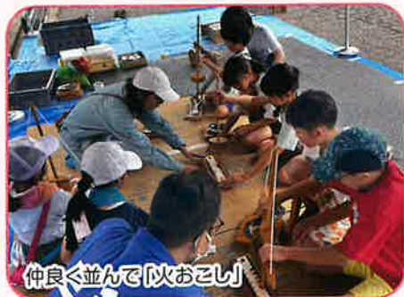
仲良く並んで吹おこし