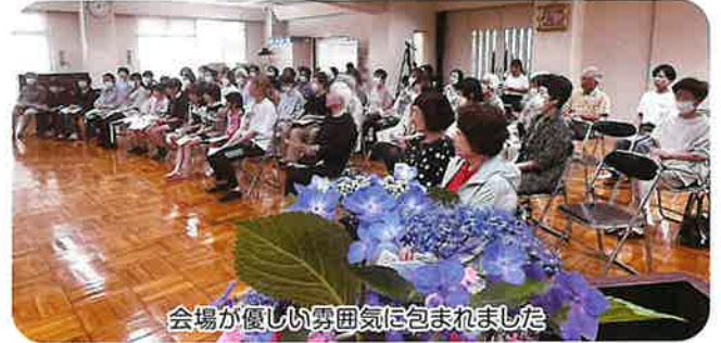
会場が優しい雰囲気になりました