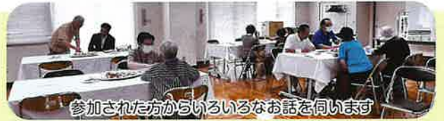
参加された方からいろいろなお話を伺います

7月28日(日)、元日の能登半島地震により被災され、三和校下に避難された皆さまを三和公民館にお招きし、癒しの会が開催されました。