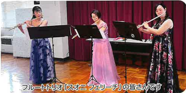
フルートトリオ「スオニ フェリーチ」の皆さんです

※「スオニ フェリーチ」とはイタリア語で「幸せな音」という意味。 フルートで紡ぐ音楽で心温まる時間を共有できたら、という思いが込められているそうです。