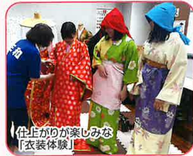
仕上げが楽しみな「衣装体験」

7月20日(土)第28回史跡フェスタ「みわ」が開催された。未明の豪雨により、外での火起こし体験が心配されたが、準備を始めるころには晴れ間も見られ予定通りの開催となり、約160名が古代の体験を楽しんだ。