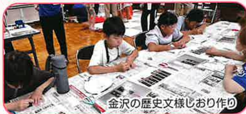
金沢の歴史文様じおり作り