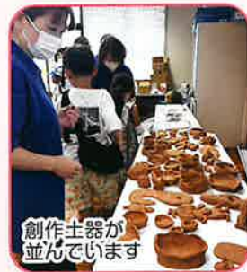
創作土器が並んでいます

昨年に引き続き三和児童館先生方による「丸もちコーナー」が人気を集めた。また、過去に子どもたちが作った「金沢かるた」による大会が行われ、かるた会場では熱戦?が繰り広げられた。