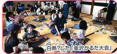
白熱?した「金沢かるた大会」

火おこしで、グリグリして、火を出すのが、むずかしかったです。しおりは、こまかくてけすつたら、色が出てくるのがきれいだと思いました。おもちを作るのがきもちよかったです。おもちの中がふわっとしていておいしかったです。 ねん土でばんだを作ったばんだの手に竹をつけてしたのがくふうです。かわいばんだが作れてうれしいです。